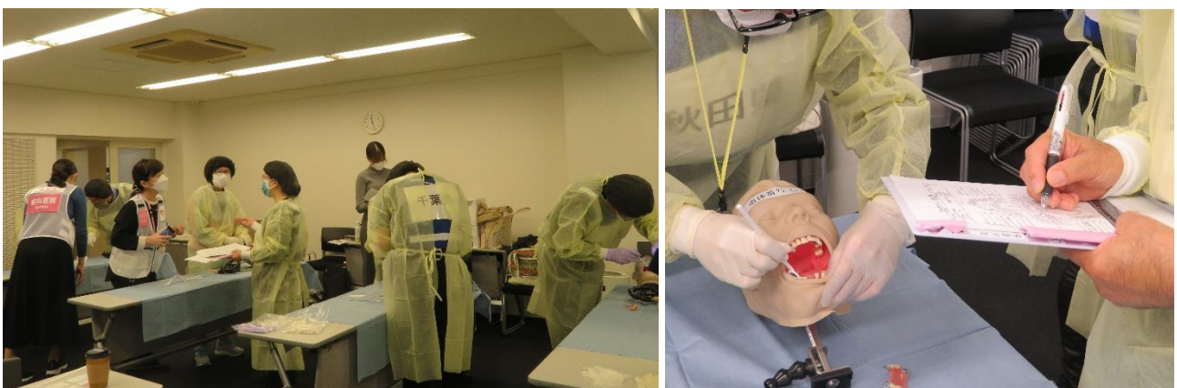
マネキンの歯科所見をデンタルチャートに記入