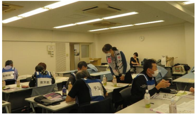
後に収集された複数の行方不明者生前情報と、先に記録されたデンタルチャートとの照合