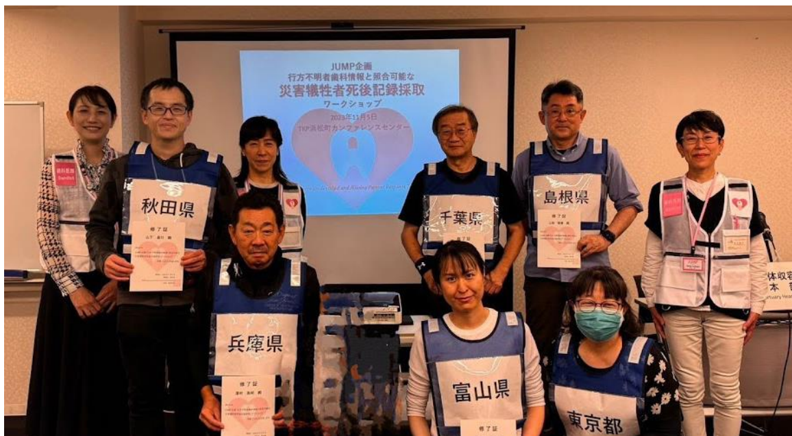
今回のWSには全国各地の歯科医師の皆様にお集まりいただきました。ありがとうございます。ご参加いただいた皆さんが今回の内容を地元の訓練で活かしていただけると大変幸いです。