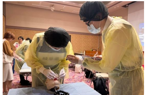
マネキンの歯科所見をデンタルチャートに記入