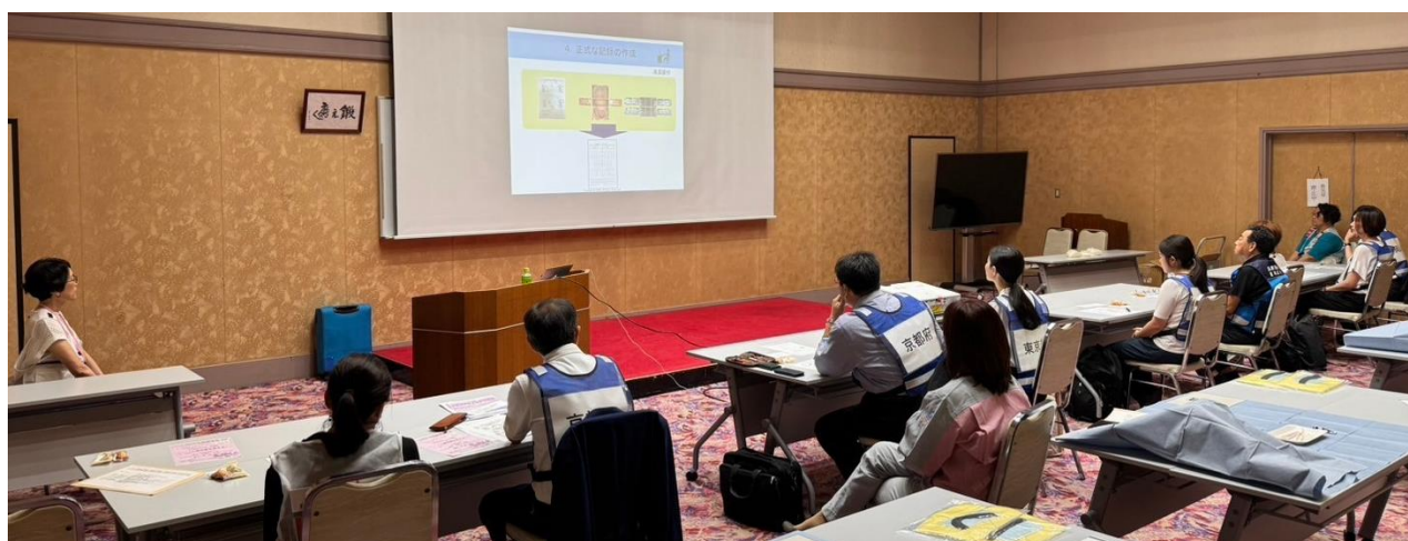
作業開始前に、JUMP 会員限定「デンタルチャート作成と生前情報との照合」動画を視聴