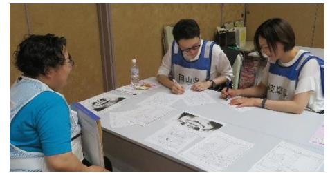
後に収集された複数の行方不明者生前情報と、先に記録されたデンタルチャートとの照合