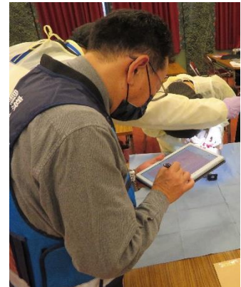
タブレット入力の様子