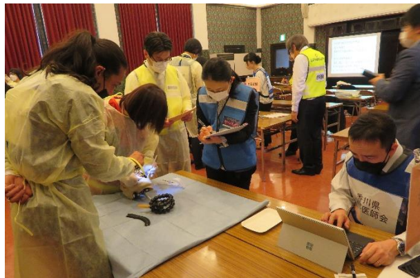
作業風景（左が遺体検査者、右が記録者）