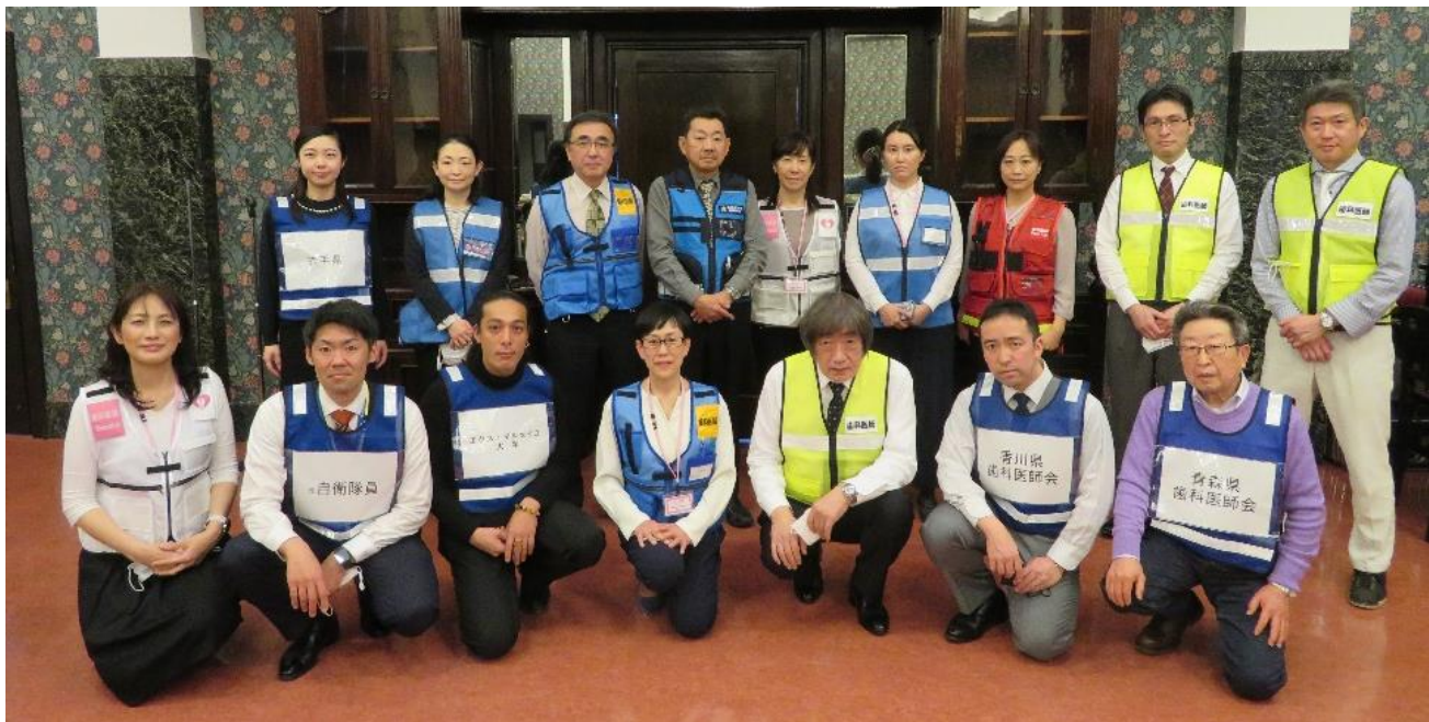
ご参加いただいた皆様